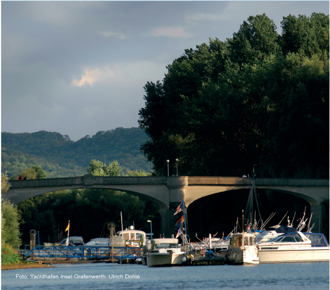
Yachthafen Insel Grafenwerth.

Bridge-Club der Bridge-Akademie Bonn / Siebengebirge